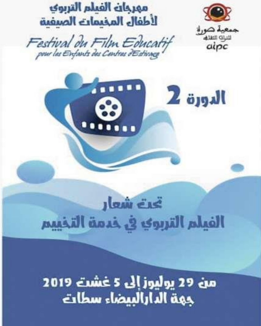
فلاش: مهرجان للفيلم التربوي بالبيضاء

تنظم جمعية صورة للتراث الثقافي، اليوم (الأربعاء) الندوة الصحافية الخاصة بتقديم برنامج الدورة الثانية لمهرجان الفيلم التربوي لأطفال المخيمات الصيفية بالمركب الثقافي سيدي بليوط ابتداء من الخامسة عصرا.