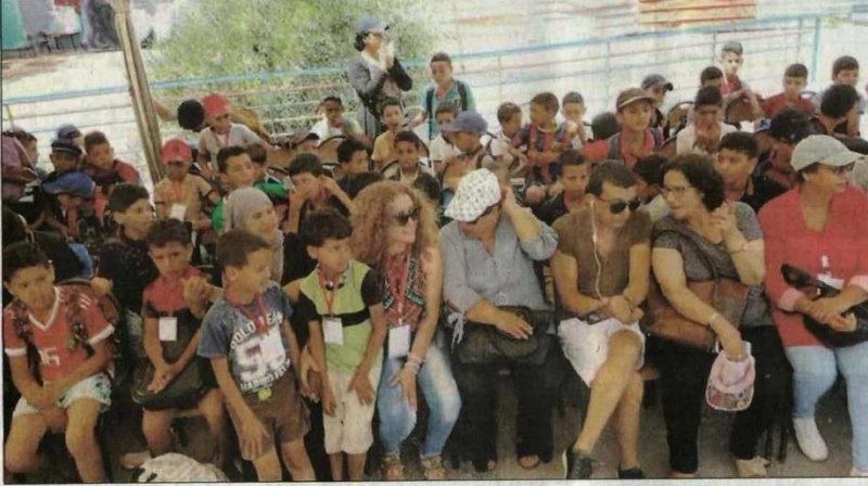
جانب من أجواء المهرجان

الروح وسي مهدي وآخرون أثنوا اختتام التظاهرة التي نظمتها جمعية "صورة"